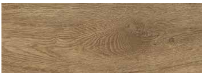
TUNDRA HONEY S12001 179 x 1220 x 4.5 mm