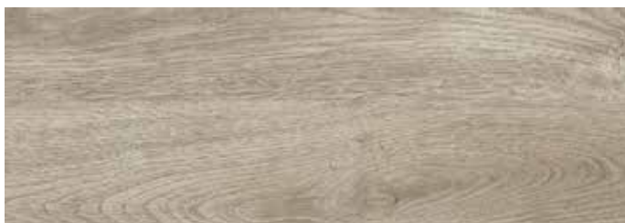
TUNDRA MIST S12003 179 x 1220 x 4.5 mm