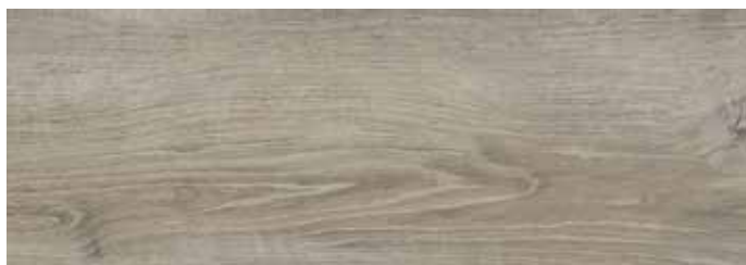
SMOKEY SILVER S20004 226 x 1220 x 5.2 mm