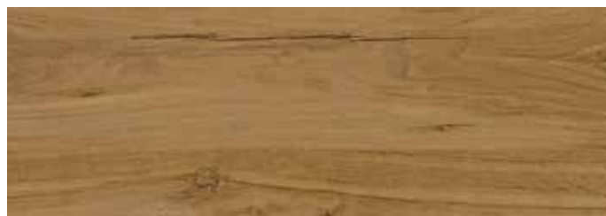
MARKHAM LIGHT S12004 179 x 1220 x 4.5 mm