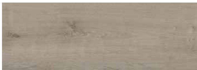
GOLDEN ARCTIC S20002 226 x 1220 x 5.2 mm