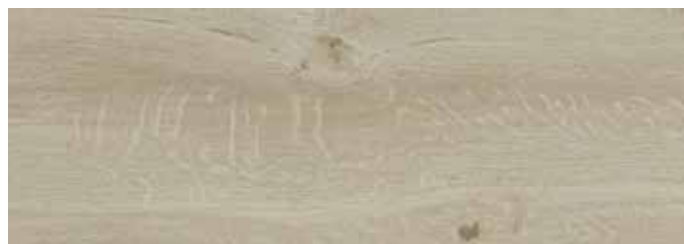
SAWN WOOD S12008 179 x 1220 x 4.5 mm