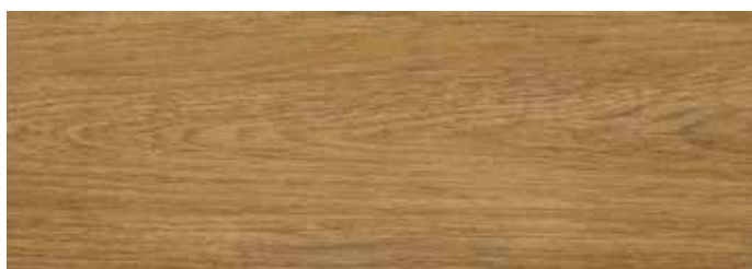
COMO CANTU S20006 226 x 1220 x 5.2 mm