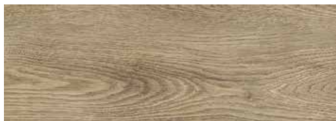
TUNDRA FJALL S12002 179 x 1220 x 4.5 mm