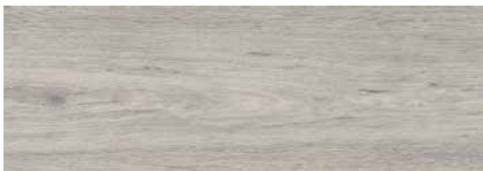
GOTHAM ARGENTO S20007 226 x 1220 x 5.2 mm