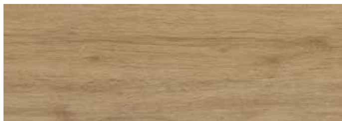
GOTHAM NATURE S20008 226 x 1220 x 5.2 mm