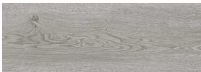
AMSTERDAM WHITE S12006 179 x 1220 x 4.5 mm