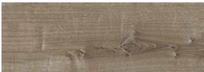
SMOKEY ALMOND S20003 226 x 1220 x 5.2 mm