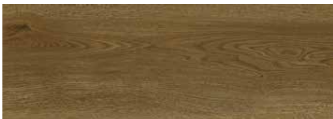
AMSTERDAM NATURAL S12007 179 x 1220 x 4.5 mm