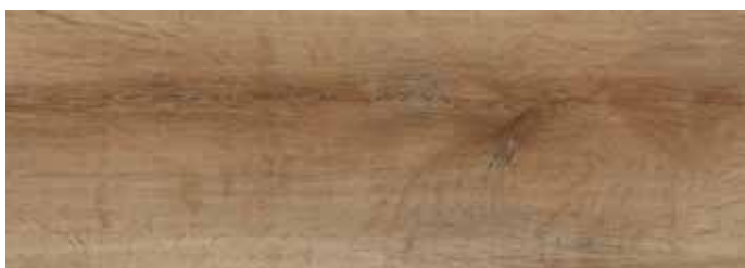
GOLDEN LIGHT S20001 226 x 1220 x 5.2 mm