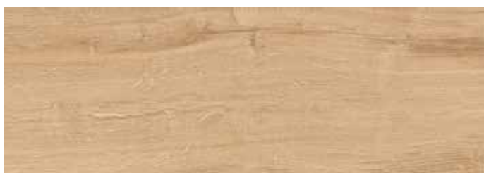
TORINO CHIARO S20005 226 x 1220 x 5.2 mm