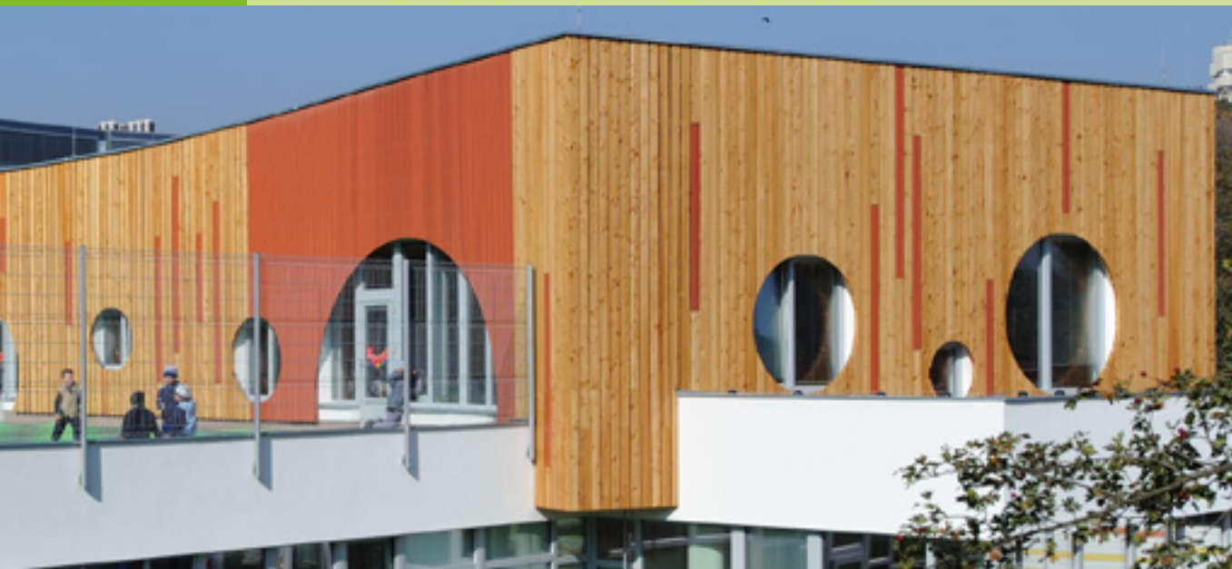
* Minimální UV ochrana

RYCHLEJŠÍ, VYDATNĚJŠÍ A ÚSPORNĚJŠÍ VE SPOTŘEBĚ