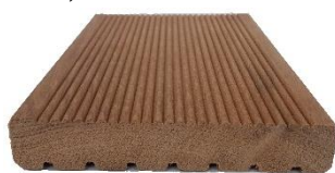
BANGKIRAI 25 x 145 mm - detail profilu

*skladové délky jsou násobky 30 cm = 2.1 m, 2.4 m, 2.7 m, 3 m, 3.3 m, 3.6 m, 3.9 m, 4.2 m, 4.5 m, 4.8 m, 5.1 m, 5.4 m, 5.7 m