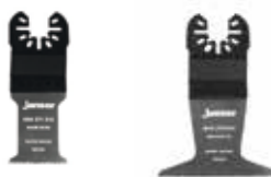
Pilové listy Multitool Rapid Wood