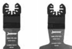
Pilové listy Multitool s hrubým ozubením