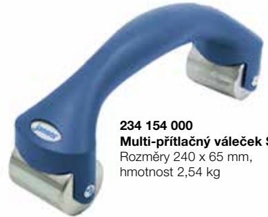
234 154 000 Multi-přítlačný váleček Single Rozměry 240 x 65 mm, hmotnost 2,54 kg