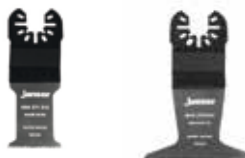
Pilové listy Multitool Rapid Wood