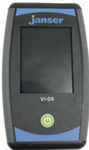
110 418 000 Vlhkoměr VI-D8 Elektronický měřicí přístroj pro nedestruktivní měření vlhkosti v minerálních materiálech jako jsou potěry a beton. 11 možností měření v jednom přístroji: 8 přednastavených měřících stupnic, měření vlhkosti dřeva, měření odporu pomocí externích sond, měření povrchové teploty pomocí IR senzoru. Vhodný také pro měření KRL s přídatnou RH sondou přes mini-USB konektor.