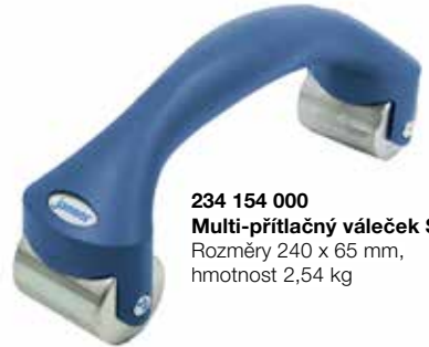
234 154 000 Multi-přítlačný váleček Single Rozměry 240 x 65 mm, hmotnost 2,54 kg