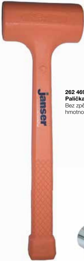
262 469 045 Palička na LVT Bez zpětného rázu, D45 mm, hmotnost 840 g