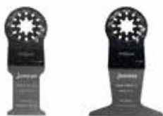
Pilové listy Starlock Bi-metalové