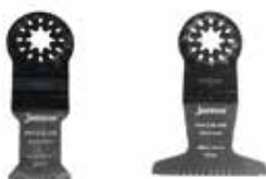
Pilové listy Starlock s japonským ozubením