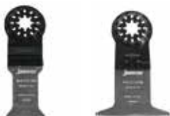
Pilové listy Starlock Rapid Wood