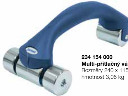
234 154 000 Multi-přítlačný váleček Single Rozměry 240 x 115 mm, hmotnost 3,06 kg