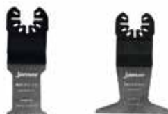
Pilové listy Multitool Bi-metalové