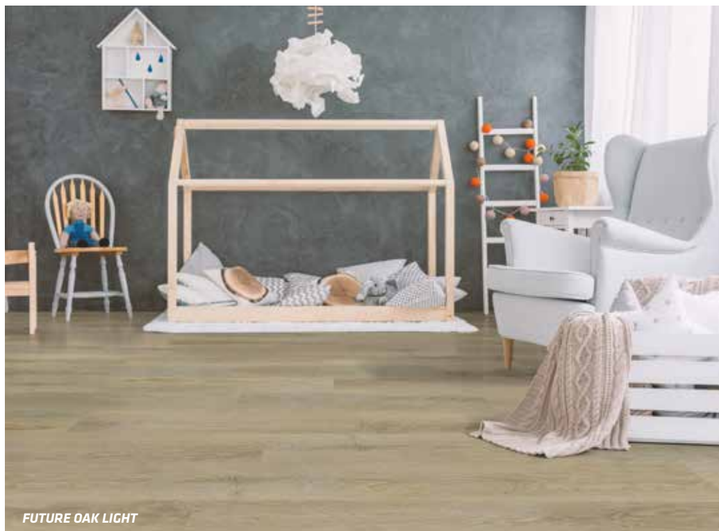
FUTURE OAK LIGHT